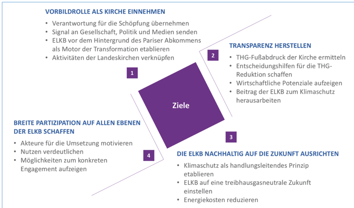
Abbildung 1: Ziele des IKK

Das Integrierte Klimaschutzkonzept beschreibt die aktuelle Treibhausgasbilanz der ELKB. Es bündelt bestehende Aktivitäten zum Klimaschutz und beschreibt drei mögliche Wege in die Zukunft. Wie bei den Klimaschutzzielen der Bundesregierung stellt das Jahr 2050 den zeitlichen Horizont dieser Szenarien dar.